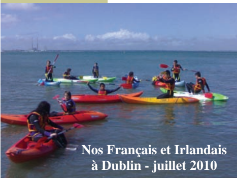
Nos Français et Irlandais à Dublin - juillet 2010

Juillet: Ecole d'Eté bilingue IN DUBLIN'S FAIR CITY